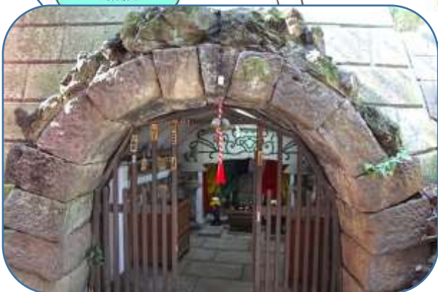
ばん龍寺・岩屋弁財天