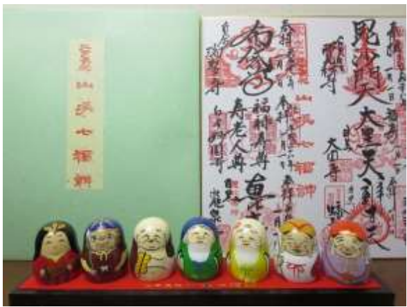
御朱印色紙・達磨